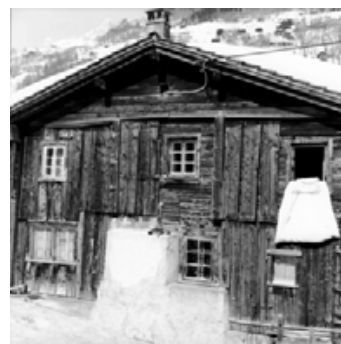
Der Verlagsitz erbaut 1596

Barsortiment: Koch, Neff & Volckmar (KN&V), 70565 Stuttgart, www.buchkatalog.de